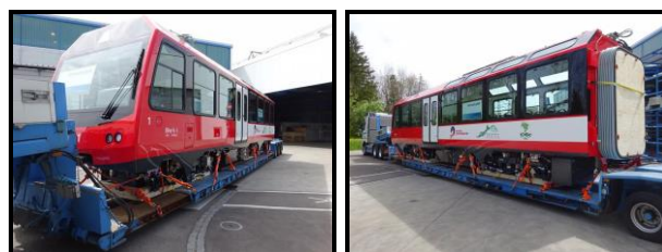
Acima, o TUE sendo embarcado em carretas rodoviárias, em direção ao Porto.